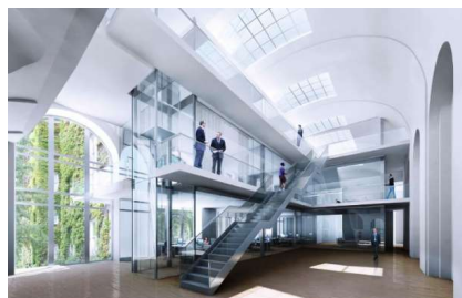
Umbau der ehemaligen Groterjan Brauerei, Berlin, 2.000 m 2 BGF