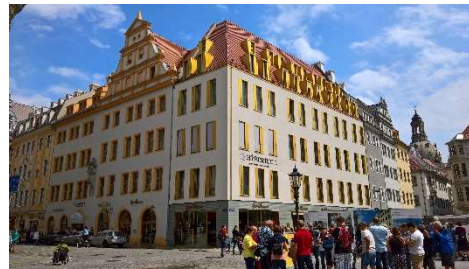
Hotel am Schloss, Dresden 17.000 m 2 BGF