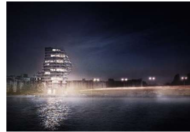
Deck One, Berlin Mischnutzung, 11.000 m 2 BGF