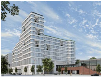
Premium Health Care & Hotel, Berlin 28.000 m 2 BGF