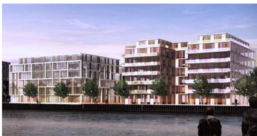
Osthafen, Berlin 21.000 m 2 BGF