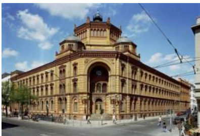
Postfuhramt, Berlin 28.000 m 2 BGF