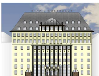
Ringmessehaus, Leipzig 36.000 m 2 BGF