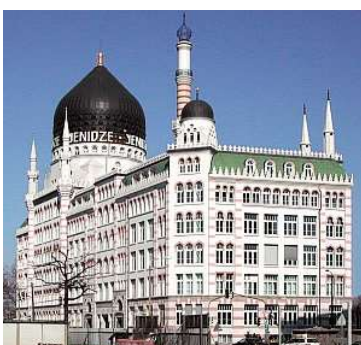
Yenidze, Dresden 11.000 m 2 BGF