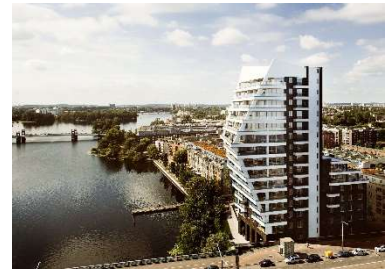
Deck One, Berlin Mischnutzung, 11.000 m 2 BGF