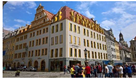
Hotel am Schloss, Dresden 17.000 m 2 BGF