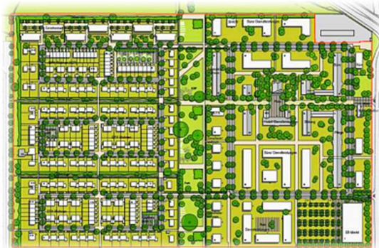
Ehemalige Freiherr-von-Fritsch Kaserne, Hannover 269.000 m 2 Grundstück