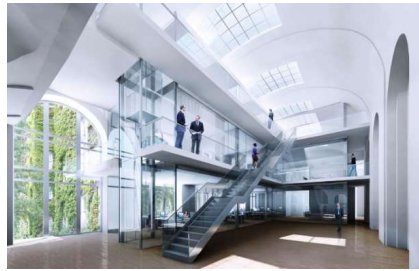
Umbau der ehemaligen Groterjan Brauerei, Berlin, 2.000 m 2 BGF