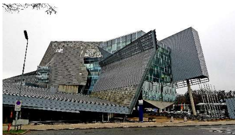
Alpen Adria Zentrum, Klagenfurt 27.983 m 2 BGF