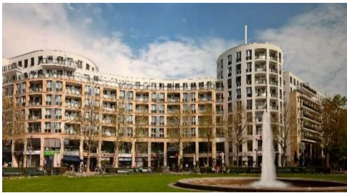
Prager Platz, Berlin 28.000 m 2 BGF